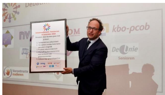
Minister Koolmees tijdens de debatmanifestatie

Zoals gewoonlijk in dit soort situaties, kon de minister niets toezeggen. De onderhandelingen liepen nog. Het pensioenoverleg in de SER is inmiddels geklapt, zoals u ongetwijfeld weet.